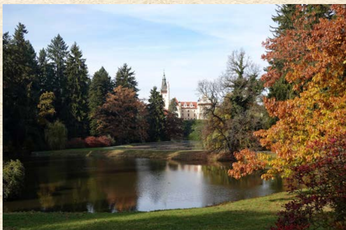
Podzimní pohled na Průhonický zámek