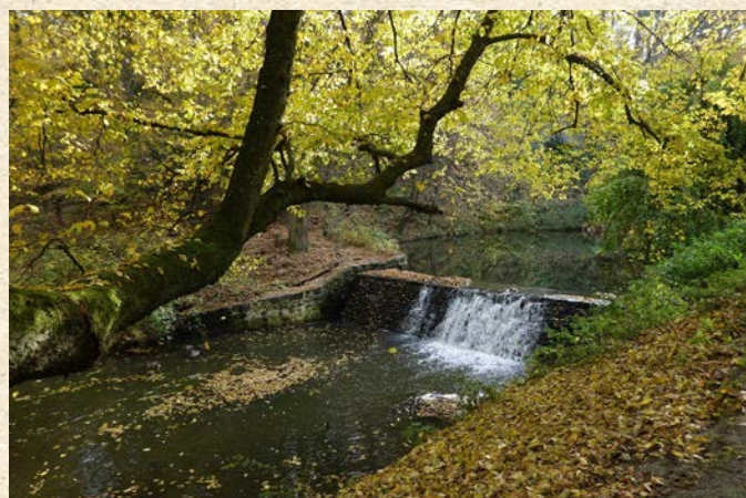
Jeho návštěvníci si tak mohou prohlédnout rybník i několik jezů