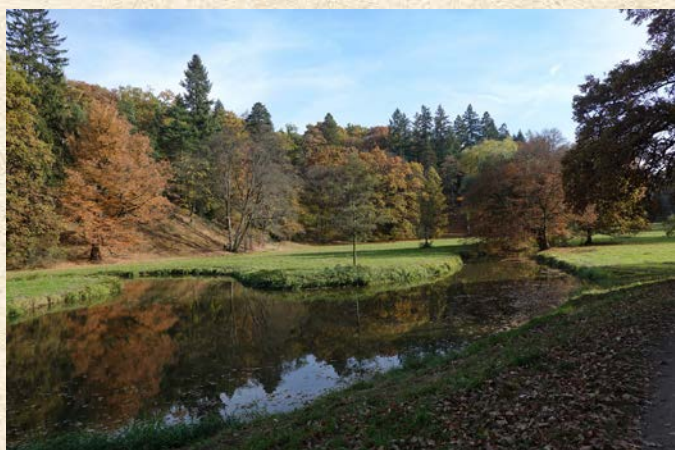
Vodní tok je atraktivním prvkem zámeckého parku