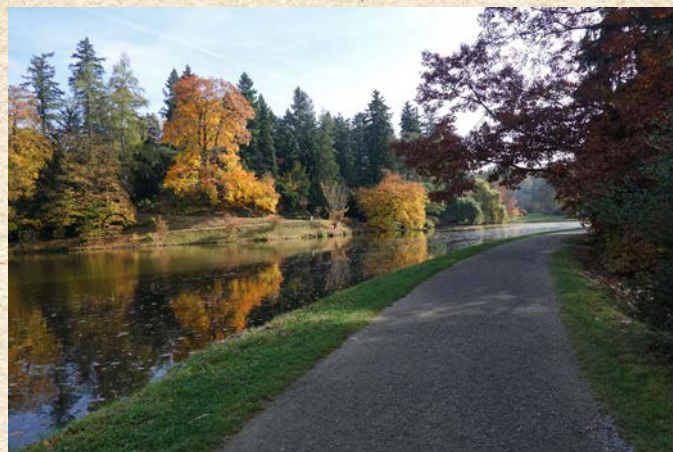
Celý park lze pohodlně obejít po upravených cestičkách