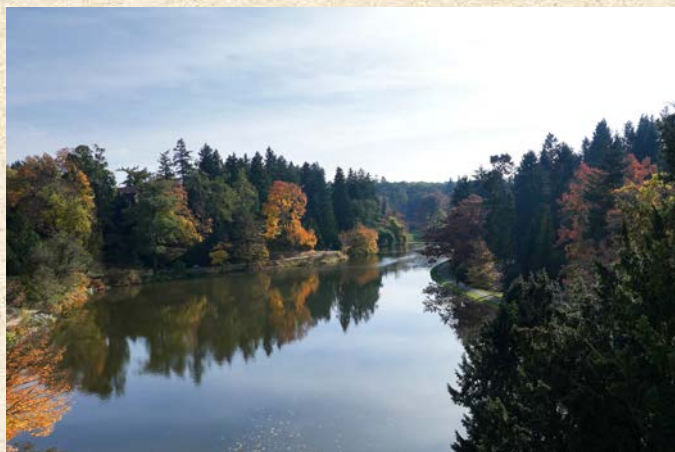
V současné době činí rozloha zámeckého parku 220 ha

Jeden z nejznámějších, ale také nejkrásnějších parků v naší zemi je zámecký park Průhonice, a není proto divu, že jde také o Národní kulturní památku zapsanou na Seznam světového dědictví UNESCO. Veřejnost láká tento park hlavně na jaře, své kouzlo však má i na podzim.