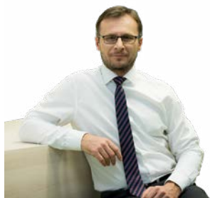
Zdeněk Nekula ministr zemědělství

Situace v sektoru prasat je v současnosti opravdu kritická. Nyní se hraje o to, ve kterých zemích chov prasat přežije, a ve kterých zcela vymizí. I s ohledem na zajištění naší potravinové bezpečnosti je důležité, aby naše chovy přežily. Zemědělství není jako tovární linka, nejde ho na měsíc vypnout a pak zase okamžitě obnovit. Proto jsem opakovaně žádal Evropskou komisi o celoevropské řešení a mimořádné podpory pro chovatele. Jsem rád, že také k tomu nakonec dojde. Česká republika bude mít z evropských zdrojů k dispozici více než 270 milionů korun, které využijeme právě pro sektor prasat a drůbeže a také pro pěstitele jablek. Ani tím ale nechci končit a budu usilovat o to, aby z českého rozpočtu bylo poskytnuto ještě dalších 540 milionů korun. A to ještě letos. Musíme získat pro náš strategický obor prostředky, a to efektivně, cíleně a včas.